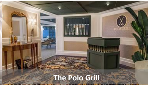
The Polo Grill