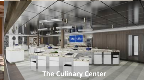
The Culinary Center