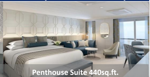
Penthouse Suite 440sq.ft.