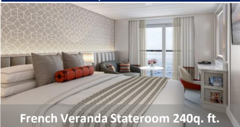
French Veranda Stateroom 240q. ft.

Space is perhaps the ultimate luxury, and that is something all our accommodations provide in lavish excess. Defined by their elegance, our staterooms feature tasteful furnishings and a serene ambiance. All staterooms also offer an oversized bathroom with a rainforest shower. You will appreciate the refrigerated mini-bar, copious closet and drawer space and our revolutionary Tranquility Bed, a luxury our guests consistently describe as heavenly.